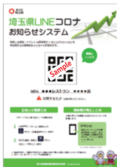
施設やお店に掲示されたQRコード