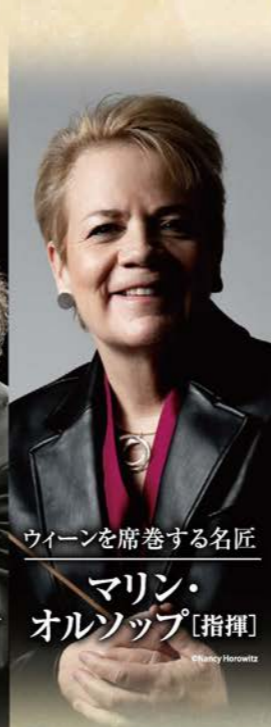
ウィーンを席卷する名匠 マリン・オルソップ [指揮]