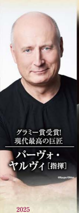
グラミー賞受賞! 現代最高の巨匠 パーヴォ・ヤルヴィ [指揮]