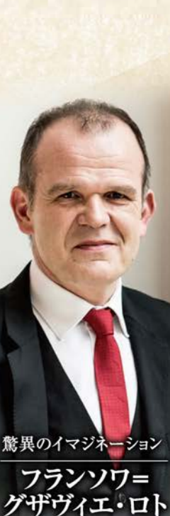
驚異のイマジネーション フランソワ=グザヴィエ・ロト [指揮]