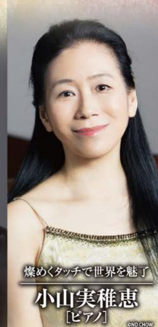
燦めくタッチで世界を魅了 小山実稚恵 [ピアノ]