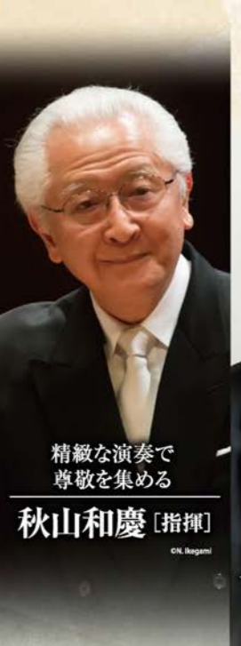
精緻な演奏で 尊敬を集める 秋山和慶 [指揮]