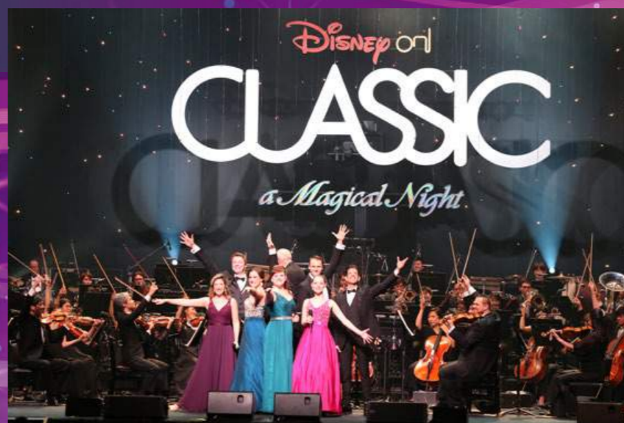
ステージ写真は昨年の公演です

ニューヨークを拠点に活動。これまでに、ミュージカル『RENT』モーリン役や、『Guys & Dolls』アデレード役、『ALL SHOOK UP』サンドラ役などを務めたほか、『Jesus Christ Superstar』北米ツアーに参加。10代の若者に向けたオーディションの参考書を執筆したり、講師を務めたりと、若手アーティストの育成にも力を注いでいる。ディズニー音楽に携わるのは、今回が初となる。