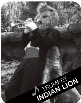
TRUMPET INDIAN LION

指揮:オカピ ズーラシアンプラスのリーダー。オカピ。頭の回転が早く、いつも新しいことを考えています。