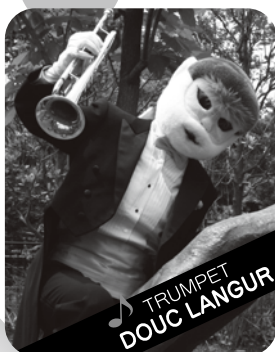
TRUMPET DOOU LANGUR

トランペット:インドライオン プライドが高く練習する姿をみんなにみせない努力家。 女の子にはとても、とても甘いです。