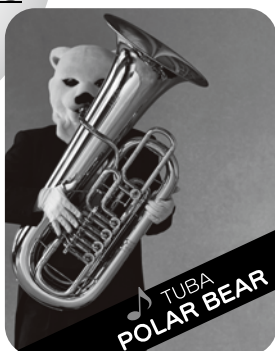
TUBA POLAR BEAR

トロンボーン:スマトラトラ 元王族のおぼっちゃま育ちですが、なぜかさがさつでクチが悪いスマトラトラです。おだてられるとすぐ調子に乗るけど、憎めないかわいところもあるのです。