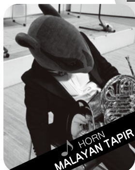
HORN MALAYAN TAPIR

ホルン:マレーバク とにかく、いつも眠っている印象のあるマイペースなマレーバクです。眠っているみたいなのは忘れてしまいます。