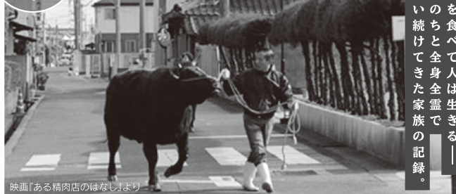
映画『ある精肉店のはなし』より