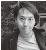
伏原健之 ●主な作品 『神宮希林 わたしの神様』

建築家の津端修一が手掛けた愛知県の高蔵寺ニュータウン。津端はその一角に自らが理想とする大きなキッチンガーデンのある小さな家を建設。ガーデンには100種類以上の野菜やフルーツが実り、妻が作る料理はどれも美味しそう。「老いたら老いたなりに楽しく生きる」を実践する(177歳の青春ストーリー)。口コミで話題となり、観客動員数は25万人を突破！第91回キネマ旬報文化映画ベスト・テン第1位受賞。