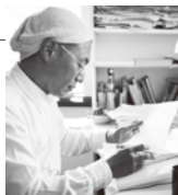
湯浅政明 ●主な作品 『マインド・ゲーム』『夜は短し歩けよ乙女』

寂れた漁港の町に住む少年・カイは、両親の離婚で父親と祖父の3人暮らし。複雑な気持ちを抱える少年にとって唯一の心の拠り所は自ら作曲した音楽をネットにアップすることだった。ある日人魚の少女・ルーとの出会いがカイを変える。突如訪れた町の危機に、カイは心からの叫びで町を救うことができるのだろうか？ アヌシー国際アニメーション映画祭長編部門グランプリ・クリスタル賞受賞。