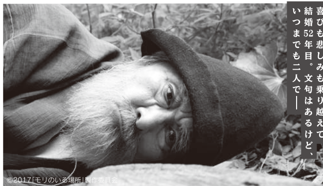
喜びも悲しみも乗り越えて、 結婚52年目。文句はあるけど、 いつまでも二人で――