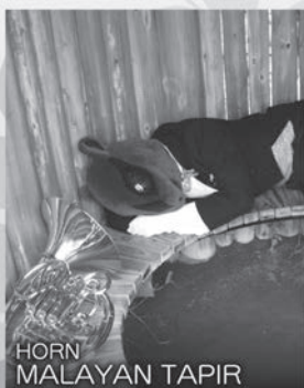
HORN MALAYAN TAPIR

エイミー(四女):第2バイオリン 末っ子のエイミーは、おしゃべりで、おませで、ちょっとわがままな愛すべき女の子です。