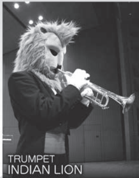
TRUMPET INDIAN LION

指揮:オカピ ズーラシアンブラスのリーダー・オカピ。頭の回転が早く、いつも新しいことを考えています。