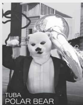
TUBA POLAR BEAR

トロンボーン:スマトラトラ 元王族のおぼっちゃま育ちですが、なぜかさがつてクチが悪いスマトラです。おだてられるとすぐ調子にのるけど、憎めないかわいところもあるのです。