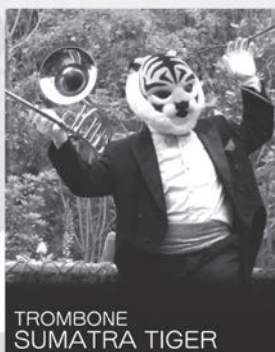
TROMBONE SUMATRA TIGER

ホルン:マレーバク とにかく、いつも眠っている印象のあるマイペースなマレーバクです。眠っているとたいていのは忘れてしまいます。