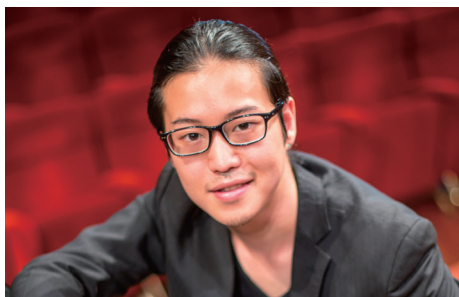
Piano / Producer 反田恭平 Kyohei Sorita

2012年 高校在学中に第81回日本音楽コンクール第1位入賞。併せて聴衆賞を受賞。 2014年チャイコフスキー記念国立モスクワ音楽院に首席で入学。 2015年イタリアで行われている「チッタ・ディ・カントゥ国際ピアノ協奏曲コンクール」古典派部門で優勝。年末には「ロシア国際音楽祭」にてコンチェルト及びリサイタルにてマリンスキー劇場デビューを果たす。 2016年のデビュー・リサイタルは、サントリーホール2000席が完売し、圧倒的な演奏で観客を惹きつけた。また夏の3夜連続コンサートをすべて違うプログラムで行い、新人ながら3,000人を超える動員を実現する。 2017年春にはオーケストラとのツアーを12公演、夏には初のリサイタル・ツアーを行い、全公演完売で終了した。現在コンサートのみならず「題名のない音楽会」「情熱大陸」等メディアでも多数取り上げられるなど、今、もっとも勢いのあるピアニストとして注目されている。