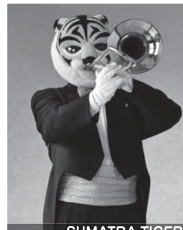
TROMBONE SUMATRA TIGER

ホルン:マレーバク とにかく、いつも眠っている印象のあるマイペースなマレーバクです。眠っていること自体は忘れてしまいます。