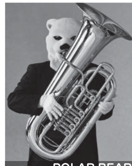
TUBA POLAR BEAR

トロンボーン:スマトラトラ 元王族のおぼっちゃま育ちですが、なぜかがつてクチが悪いので、おたれられるとすぐ調子にのるけど、憎めないかわいところもあるのです。