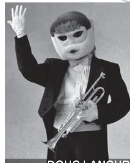
TRUMPET DOUC LANGUR

トランペット:インドライオン プライドが高く練習する姿をみんなにみせない努力家。女の子にはとても、とても甘いです。