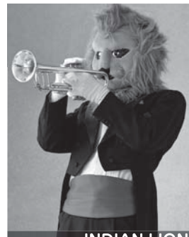
TRUMPET INDIAN LION

指揮:オカピ 未来を信じるズーラシアンブラスのリーダー・オカピ。頭の回転が早く、いつも新しいことを考えています。