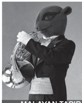
HORN MALAYAN TAPIR

エイミー(四女):第2バイオリン 末っ子のエイミーは、おしゃべりで、おませで、ちょっとわがままな愛すべき女の子です。