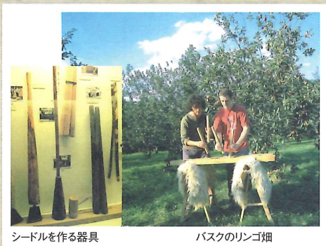
シードルを作る器具