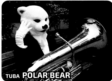
TUBA POLAR BEAR

トロンボーン:スマトラトラ 元王族のおぼっちゃま育ちですが、なぜかがさつでクチが悪いスマトラトラです。