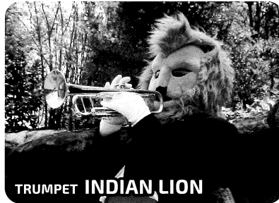
TRUMPET INDIAN LION

指揮:オカピ 未来を信じるズーラシアンブラスのリーダー・オカピ。頭の回転が早く、いつも新しいことを考えています。