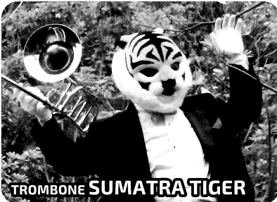
TROMBONE SUMATRA TIGER

第2バイオリン:エイミー(四女) 末っ子のエイミーは、おしゃべりで、おませで、ちょっとわがままな愛すべき女の子です。