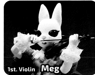
1st. Violin Meg

トランペット:インドライオン プライドが高く練習する姿をみんなにみせたい努力家です。