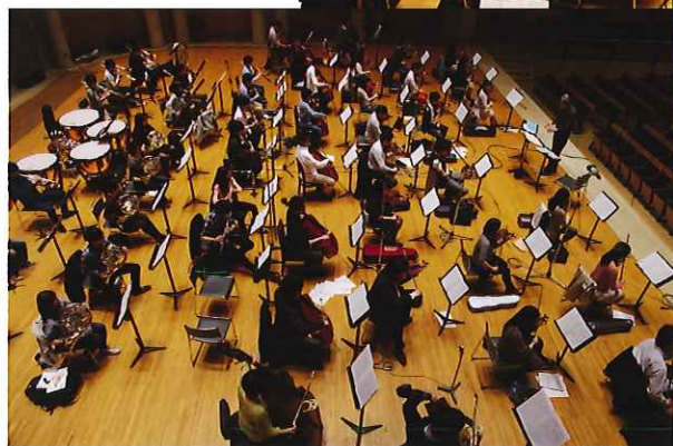
←チャイコフスキーの収録風景