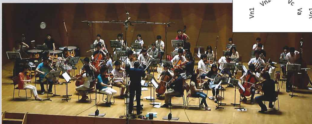
「英雄」の収録風景 半円形のフルテット6組を全面2列に配置