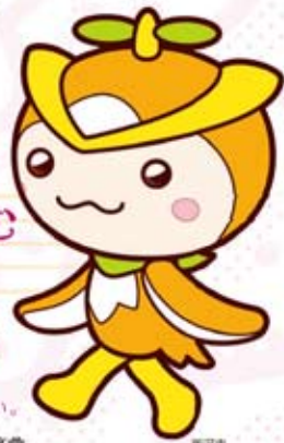
所沢市 イメージマスコット 「トコロん」

曲目 ●ロッシーニ:オペラ「セヴィリアの理髪師」序曲 ●W.A.モーツァルト:ファンタジー ヘ短調 ほか